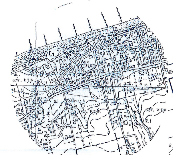
Wykaz zmian gruntowych