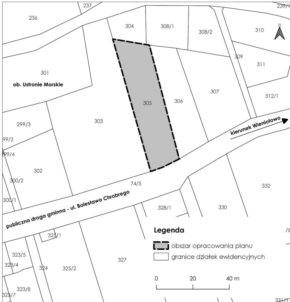
Rys. 1 Granica obszaru objętego przystąpieniem do sporządzania planu miejscowego