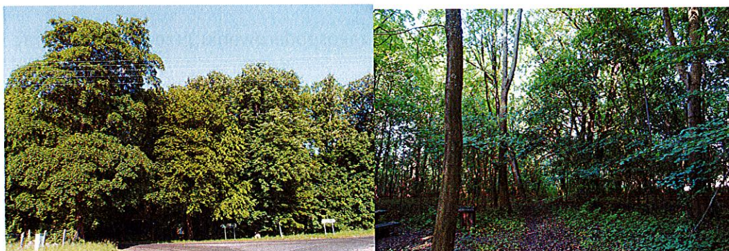
Zdjęcia nr 7, 8. Park dworski, Rusowo

Park położony jest w północno-wschodniej części wsi, pierwotnie powierzchnia parku wynosiła 37,62 ha. Właścicielem parku jest gmina Ustronie Morskie, która ma w udziale 15,31 ha - jest to działka nr 320/16.