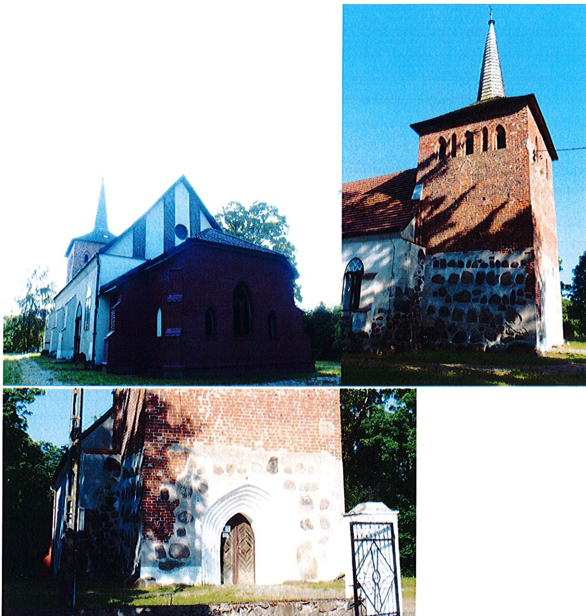
Zdjęcia nr 3, 4, 5. Kościół Matki Bożej Różańcowej w Rusowie

Gotycki kościół zabytkowy Matki Bożej Różańcowej z XVI w., przebudowany w 1684 r. Kościół w Rusowie jest jedną z najstarszych świątyń chrześcijańskich na Pomorzu, dziś liczy sobie ponad 600 lat. Pełni funkcję kościoła filialnego rzymskokatolickiej parafii Podwyższenia Krzyża Świętego w Ustroniu Morskim. Kościół usytuowany jest na niewielkim wzniesieniu, koło stawy, dokładnie na osi wschód-zachód, czyli jest on zwrócony miejscem przeznaczonym na główny ołtarz, na Jerozolimę - Grób Pański.