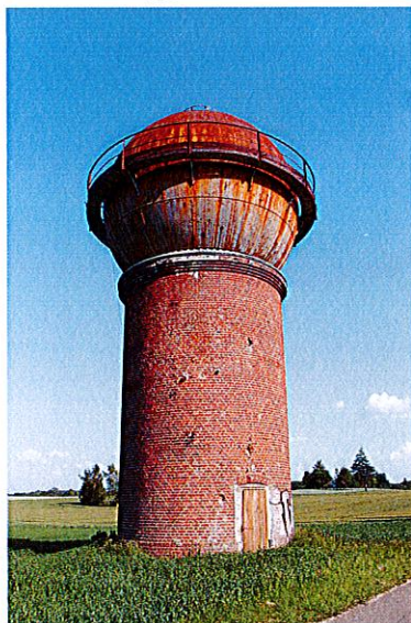
Zdjęcie nr 6. Wodociągowa wieża ciśnień w Rusowie

Wieżę zbudowano w 1908 r. Wieża zakończyła pracę około roku 1991/1992. Jest to obiekt murowano-stalowy o cylindrycznej formie trzonu murowanego i kulistym, stalowym zbiorniku na jego szczycie. Jest to zbiornik typu Klönne (o pojemności 190 m 3 ). Obiekt murowany z cegły budowlanej, palonej.