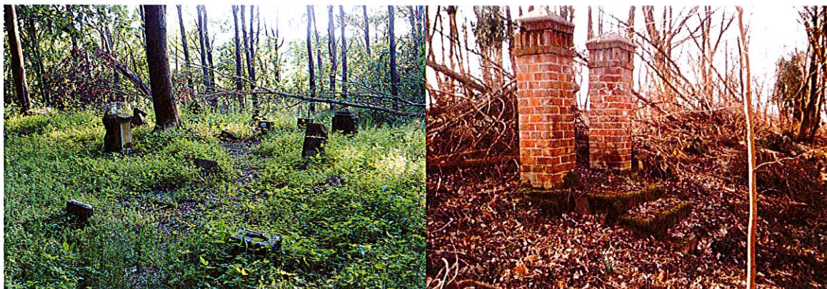
Zdjęcia nr 1, 2. Cmentarz polowy w Bagiczu

Cmentarz polowy, dawniej ewangelicki założony w ok. 1890 r., zamknięty od 1948 r. Po II wojnie światowej przez kilkadziesiąt lat był niedostępny. Cmentarz założony na planie trapezu o trzech bokach prostokątnych, o powierzchni 0,91 ha, główne wejście od strony wschodu i aleją na osi wejścia. Ogólny stan cmentarza zły, groby zdewastowane. Wciąż znajduje się tam jeszcze wiele pozostałości po nagrobkach oraz grobowcach, pośrodku których wyrastają sporych rozmiarów drzewa. Zachowało się tam kilkanaście nagrobków z widocznymi nazwiskami, datami urodzin i śmierci, ale większość grobów jest rozkopana.