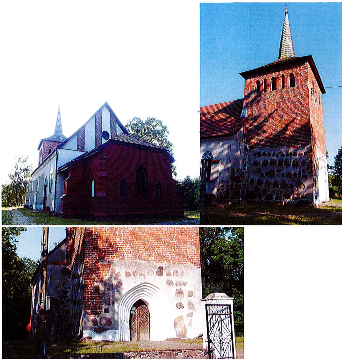
Zdjęcia nr 3, 4, 5. Kościół Matki Bożej Różańcowej w Rusowie

Gotycki kościół zabytkowy Matki Bożej Różańcowej z XVI w., przebudowany w 1684 r. Kościół w Rusowie jest jedną z najstarszych świątyń chrześcijańskich na Pomorzu, dziś liczy sobie ponad 600 lat. Pełni funkcję kościoła filialnego rzymskokatolickiej parafii Podwyższenia Krzyża Świętego w Ustroniu Morskim. Kościół usytuowany jest na niewielkim wzniesieniu, koło stawy, dokładnie na osi wschód-zachód, czyli jest on zwrócony miejscem przeznaczonym na główny ołtarz, na Jerozolimę - Grób Pański.