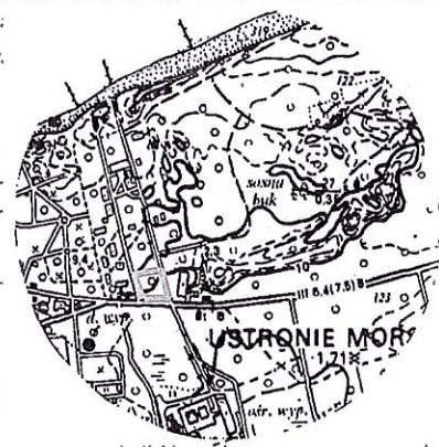
Wykaz zmian gruntowych